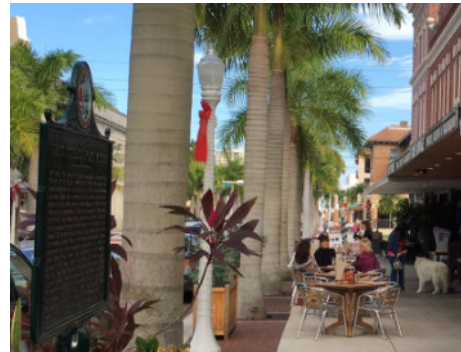
Fort Myers River District